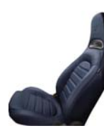
Tapicerka skórzana niebieska (opcja 494)