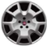
Kolpaki ochronne kół