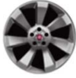
Obłęczce ze stopów lekkich 16"