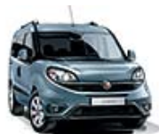
448 Niebieski Canalgrande (metalizowany)