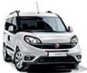
249 Bialy Gelato (pastelowy)