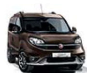
444 Brązowy Magnetico (metalizowany) tylko dla wersji Trekking