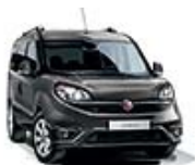
695 Szary Colosseo (metalizowany)