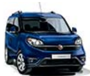
479 Granatowy Riviera (pastelowy)