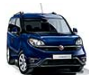
487 Granatowy Mediterraneo (metalizowany)