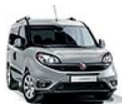
612 Szary Maestro (metalizowany)