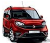
168 Czerwony Passione (pastelowy)