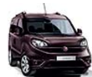
590 Bordowy Montalcino (metalizowany)