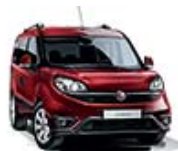
293 Czerwony Amore (metalizowany)