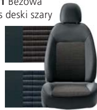
371 Beżowa Pas deski szary