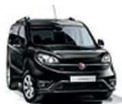
632 Czarny Tenore (metalizowany)