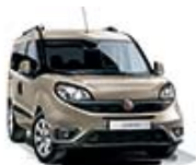
261 Beżowy Spumante (metalizowany)