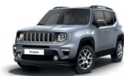
348 Srebrny Glacier (metalizowany)