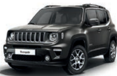
503 Sting Grey (pastelowy)