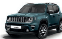
435 Niebieski Shade (metalizowany)