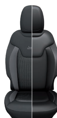
Tapicerka materiałowa / skórzana