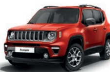
176 Czerwony Colorado (pastelowy)