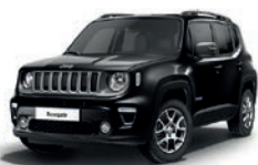
601 Czarny Solid (pastelowy)