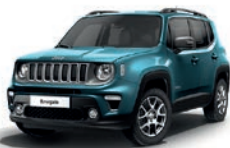
470 Bikini (metalizowany)