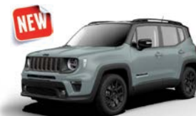
223 Matter Azue (metalizowany)