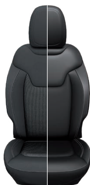
Tapicerka materiałowa / skórzana