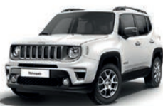
296 Biały Alpine (pastelowy)