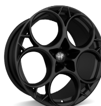
21" Felgi aluminiowe Modale Dark Kod opcji 3EQ