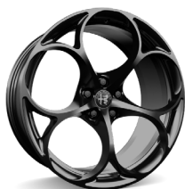
20" Felgi aluminiowe Sport 2 Dark Glossy Kod opcji 3EN