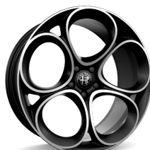
20" Felgi aluminiowe Sport 2 Dark Glossy Kod opcji WRD