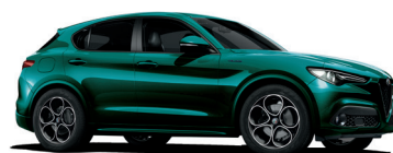
398 ZIELONY SPECJALNY - MONTREAL GREEN