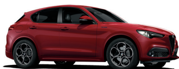
414 CZERWONY - ALFA RED