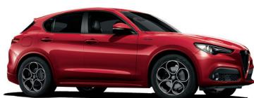
645 CZERWONY SPECJALNY - ETNA RED