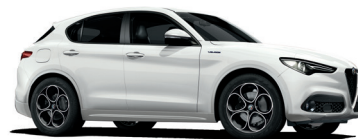
217 BIAŁY - ALFA WHITE