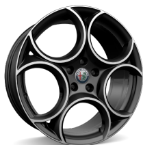
19" Felgi aluminiowe Sport Silver Matt/ Grey Kod opcji 3DY

Oznaczenia w cenniku: podane kwoty w zł z VAT / ■ wyposażenie standardowe / - wyposażenie niedostępne / P wyposażenie dostępne w pakiecie