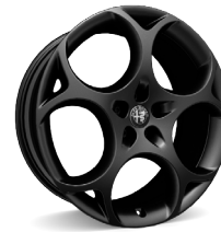
21" Felgi aluminiowe Modale Dark Kod opcji 3ET