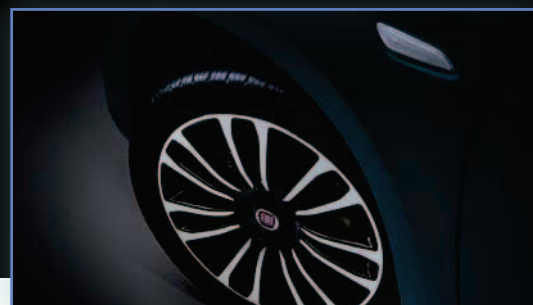
17" Felgi aluminiowe z diamentowym szlifem