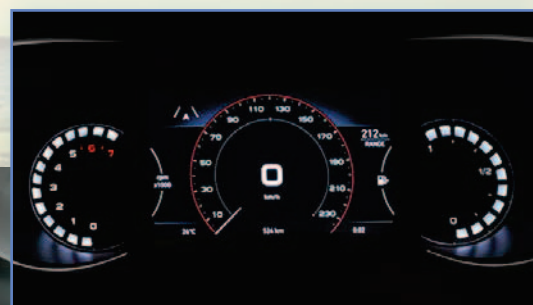
7" kolorowy wyświetlacz TFT komputera pokładowego