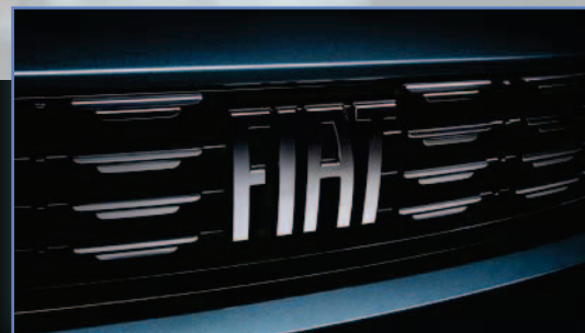
Nowe logo i aktywny przedni grill