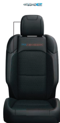
CZARNA TAPICERKA MATERIAŁOWA Premium