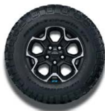
17" lakierowane obręcze kół Rubicon 4xe (standard)

■ wyposażenie standardowe - wyposażenie niedostępne P pakiet / opcja dostępna w pakiecie