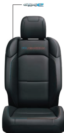
CZARNA TAPICERKA SKÓRZANA