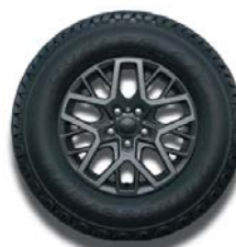
18" polerowane obręcze kół w kolorze Tech Grey Sahara 4xe (standard)