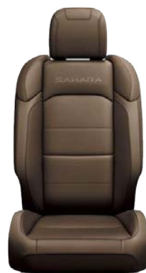
TAPICERKA SKÓRZANA w kolorze Dark Saddle