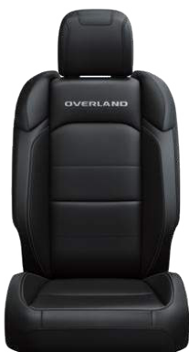
CZARNA TAPICERKA SKÓRZANA McKinley SAHARA z pakietem Overland