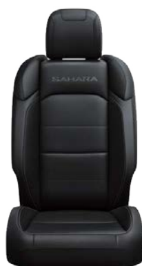
CZARNA TAPICERKA SKÓRZANA