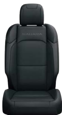
CZARNA TAPICERKA MATERIAŁOWA