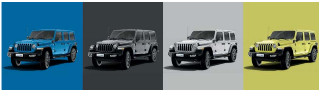
858 Hydro Blue (perłowy)