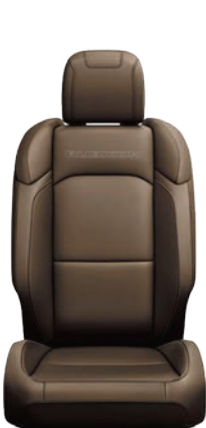
TAPICERKA SKÓRZANA w kolorze Dark Saddle