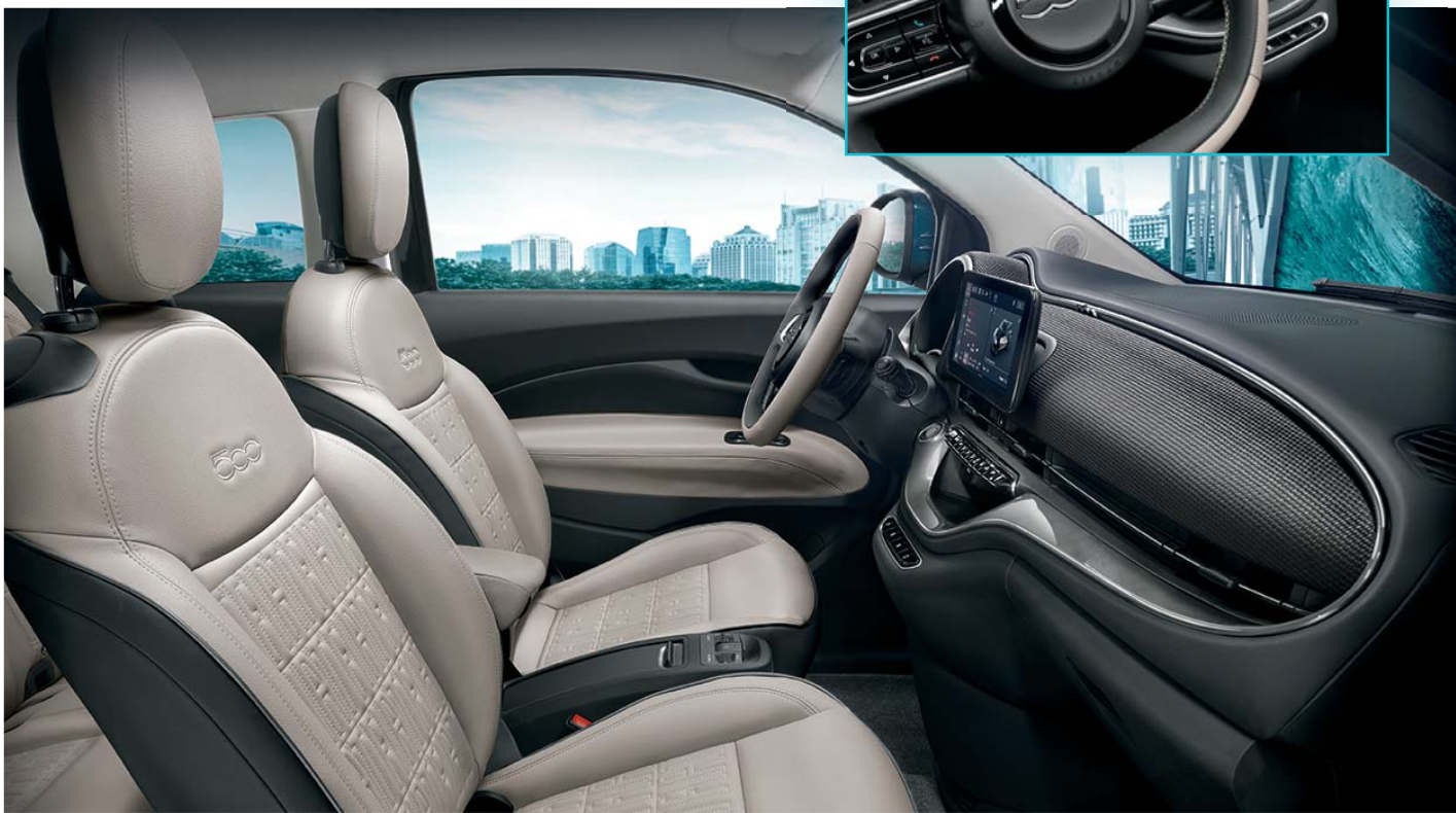
Fotele z monogramem Fiat