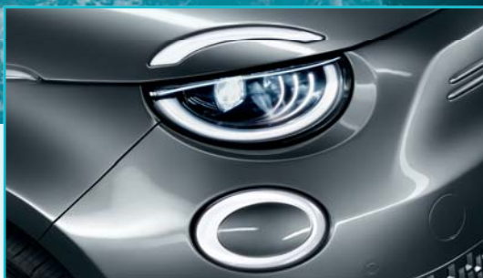
Światła LED Infinity