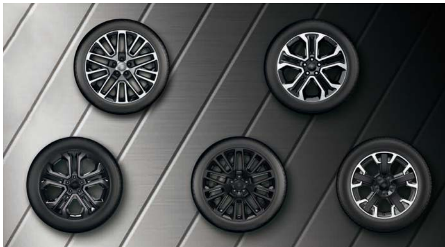
Aluminiowe obrzęcze kół 18" NIGHT EAGLE (standard) UPLAND (standard)