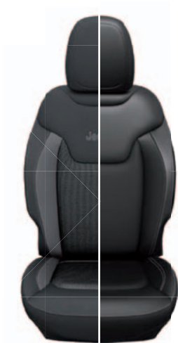
Tapicerka materiałowa / skórzana