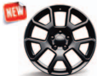
Aluminiowe obręcze kół 17"