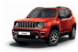
176 Czerwony Colorado (pastelowy)