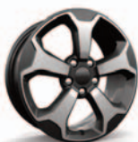
Aluminiowe obręcze kół 17"