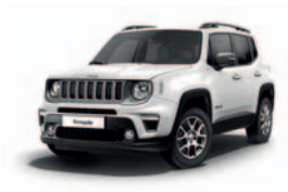
296 Biały Alpine (pastelowy)