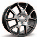
Aluminiowe obręcze kół 17"