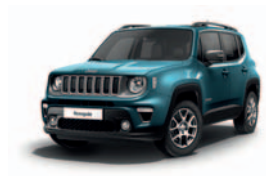
470 Turkusowy Bikini (metalizowany)