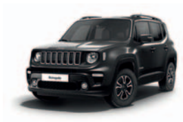
679 Grafitowy Gray (metalizowany)