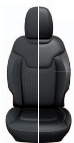
Tapicerka materiałowa / skórzana