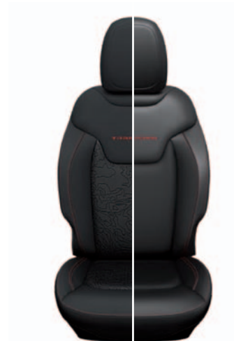
Tapicerka materiałowa / skórzana