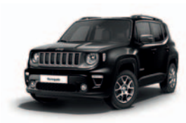
601 Czarny Solid (pastelowy)