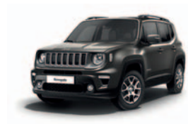
503 Szary Sting Gray (pastelowy)