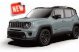
223 Matter Azue (metalizowany)