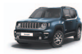
435 Blue Shade (metalizowany)