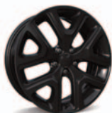
Aluminiowe obręcze kół 18" w kolorze Gloss Black