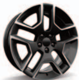
Aluminiowe obręcze kół 19"