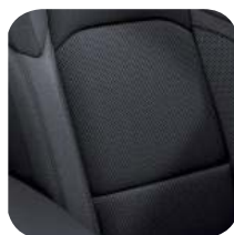
TAPICERKA MATERIAŁOWA BLACK