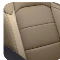
TAPICERKA SKÓRZANA DARK SADDLE