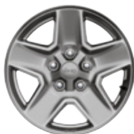
Aluminiowe obręcze kół 17" TECH SILVER