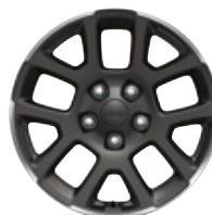
Aluminiowe obręcze kół 18" GRANITE CRYSTAL