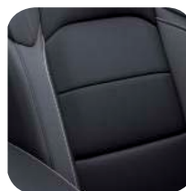
TAPICERKA SKÓRZANA BLACK