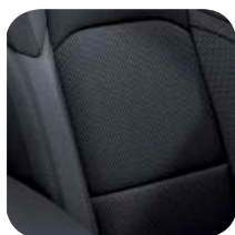
TAPICERKA MATERIAŁOWA BLACK SPORT