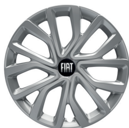
Felgi stalowe, kotpak