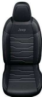
CZARNA SKÓRA Z SZARMI PRZESZYCIAMI (OPCJA)