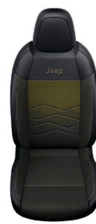
TKANINA ROBIN Z ŻÓŁTYM WYKOŃCZENIEM I WINYLOWYMI BOKAMI