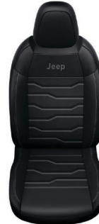
CZARNA SKÓRA Z SZARMI PRZESZYCIAMI (OPCJA)