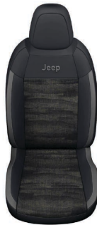
TKANINA DIGITAL JANE