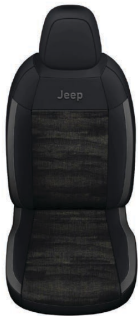
TKANINA DIGITAL JANE