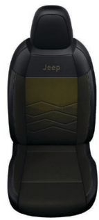
TKANINA ROBIN Z ŻÓŁTYM WYKOŃCZENIEM I WINYLOWYMI BOKAMI