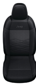
SZARA TKANINA ROBIN Z WINYLOWYMI BOKAMI