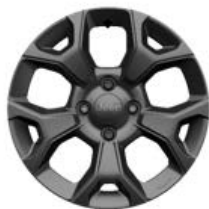
Aluminiowe obręcze kół 16" LONGITUDE (standard)