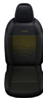
TKANINA ROBIN Z ŻÓŁTYM WYKOŃCZENIEM I WINYLOWYMI BOKAMI