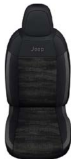
TKANINA DIGITAL JANE