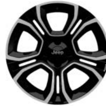
Aluminiowe obręcze kół 18" SUMMIT (standard) ALTITUDE (opcja)