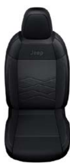
SZARA TKANINA ROBIN Z WINYLOWYMI BOKAMI