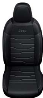
CZARNA SKÓRA Z SZARMI PRZESZYCIAMI (OPCJA)