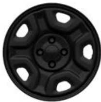
Stalowe obręcze kół 19" AVENGER (standard)

■ wyposażenie standardowe – wyposażenie niedostępne P Pakiet