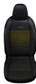
TKANINA ROBIN Z ŻÓŁTYM WYKOŃCZENIEM I WINYLOWYMI BOKAMI