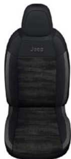
TKANINA DIGITAL JANE