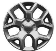
Aluminiowe obręcze kół 17" LONGITUDE (opcja)