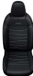
CZARNA SKÓRA Z SZARMI PRZESZYCIAMI (OPCJA)