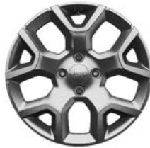
Aluminiowe obręcze kół 17" ALTITUDE (standard)