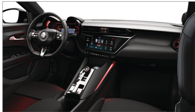
SPIGA (Pakiet Premium)