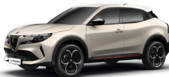
636 SZARY - SCALA