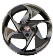
17" Felgi aluminiowe Diamond Cut Kod opcji 1M3