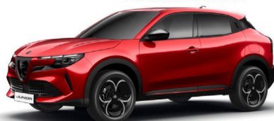
136 CZERWONY - BRERA