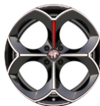
20" Felgi aluminiowe Perfo Kod opcji 5RK