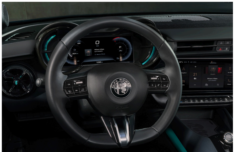
Panel zegarów „Cannocchiale”