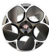
18" Felgi aluminiowe Aero Kod opcji 2VX