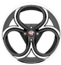
18" Felgi aluminiowe Progressive Kod opcji WP8