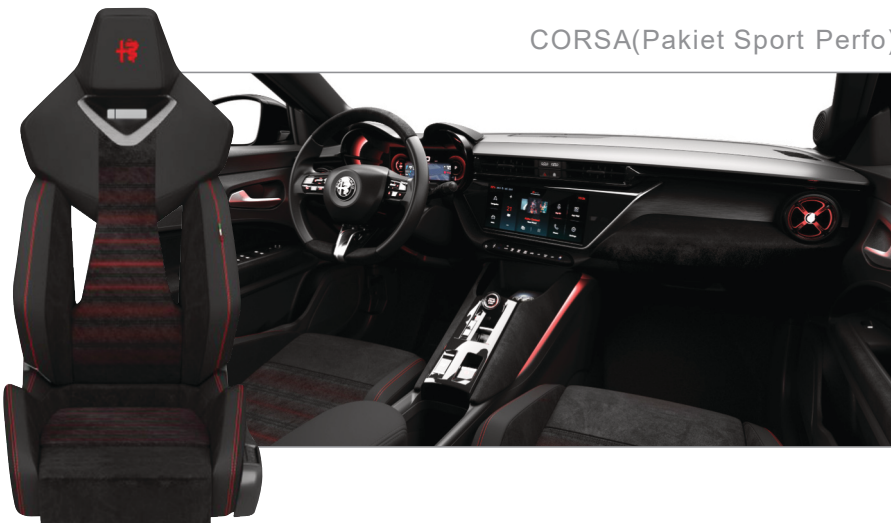
CORSA (Pakiet Sport Perfo)

Standard dla wersji: Ibrida Speciale, Elettrica Speciale, Elettrica Veloce 240 KM