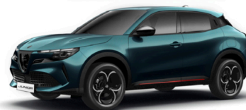
688 NIEBIESKI - NAVIGLI