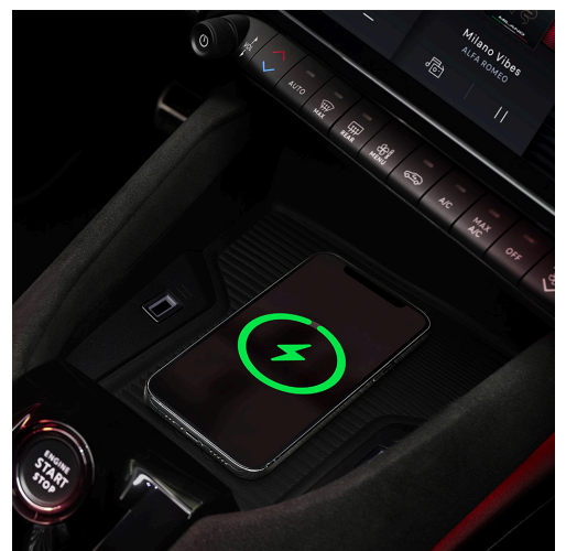
Bezprzewodowa ładowarka smartfona