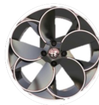
18" Felgi aluminiowe Diamond Cut Kod opcji 1M5