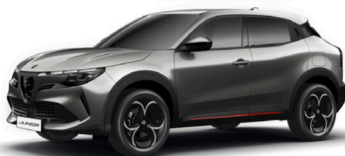
519 SZARY - ARESE