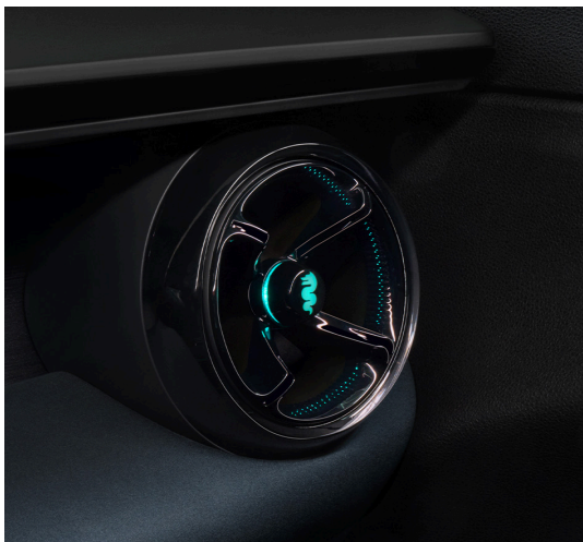
Podświetlenie bocznych nawiewów powietrza