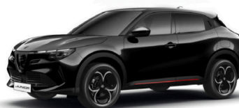
601 CZARNY - TORTORA