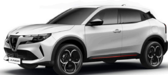
268 BIAŁY - SEMPIONE