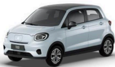
● Glacier Blue