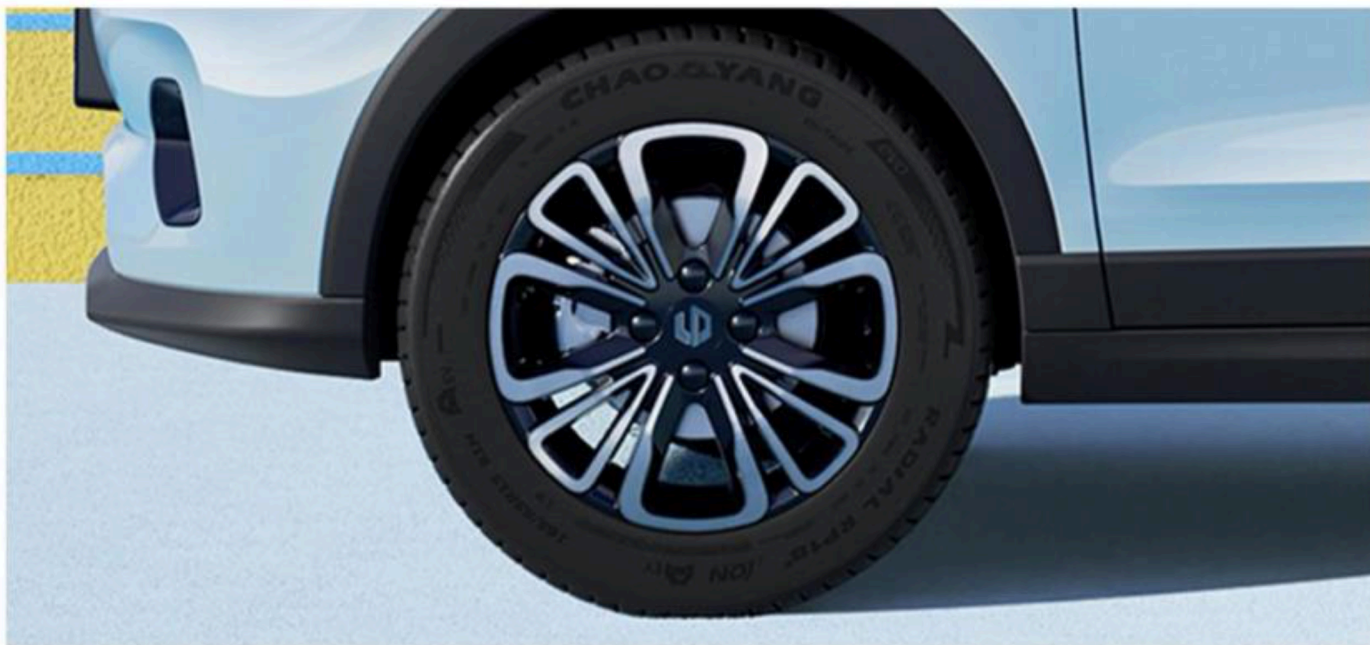
15" felgi aluminiowe