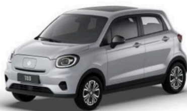
● Starry Silver